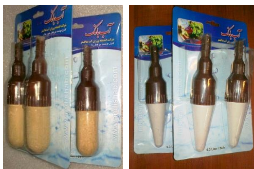
شکل ۲- دستگاه آب بانک.

اساس کار دستگاه آب بانک (شکل ۲) مشابه دستگاه تانسومتر خاک است. دستگاه تانسومتر خاک یک سیستم کنترل هوشمند اندازه‌گیری مکش خاک است که به دلیل عدم استفاده از تجهیزات الکتریکی در فرآیند اندازه‌گیری مکش از دسته دستگاه‌های غیرفعال محسوب می‌شود. کار دستگاه تانسومتر خاک، اندازه‌گیری مکش خاک بوده و کاربرد مقدار مکش را به میزان رطوبت خاک ارتباط می‌دهد. این در حالی است که کار دستگاه آب بانک، تأمین رطوبت مورد نیاز گیاه و خاک است. این دستگاه ساخت شرکت اندیشاب ایران بوده و دارای شماره ثبت اختراع ۸۰۷۳۳ در اداره مالکیت‌های صنعتی می‌باشد. دستگاه آب‌بانک از دو بخش منبع آب و کلاهک سفالی تشکیل شده است. منبع آب ۳۳۰ میلی‌لیتری از جنس ظروف پلاستیکی (انواع بطری‌های رایج نوشیدنی در بازار) یک و یک و نیم لیتری می‌باشد که کار آن تأمین آب مورد نیاز کلاهک است. کلاهک دستگاه نیز، یک گسیلنده از جنس سفال به نام کپسول رسی متخلخل لعاب اندود شده با دوغاب اکسید تیتانیوم یا اکسید آهن است.