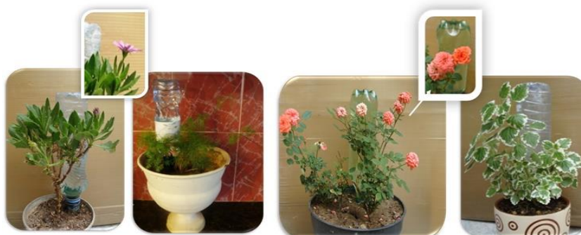
شکل ۴- نحوه کارگذاری دستگاه آب بانک در جوار ریشه گیاهان مختلف