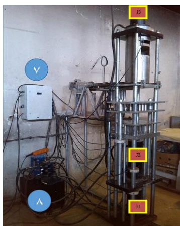
شکل ۱- دستگاه اتوماسیون تولید کپسول رسی متخلخل

به منظور تولید کپسول‌های رسی متخلخل از دستگاه اتوماسیون کپسول رسی استفاده شد (شکل ۱). این دستگاه به سفارش شرکت اندیشه ورزان آب نما گستر و تحت لیسانس شرکت داتیس انرژی ایران و با حمایت مالی معاونت علم و فناوری ریاست جمهوری ساخته شده است. این دستگاه قابلیت تحویل حداقل ۲۰۰۰ قطعه خام در یک روز کاری را داشته و نمونه مشابه خارجی ندارد. محصول آن قطعات سفالی به طول ۱۲ و قطر خارجی ۳/۵ و ضخامت دیواره‌ی یک سانتی‌متری است. برای تولید قطعات ۳/۵*۳ سانتی متری از قطعات تولید شده ۱۲*۳/۵ سانتی متر استفاده می‌شود. قطعات خام در کوره الکتریکی در دمای ۹۸۰ درجه سانتی گراد به مدت ۸ ساعت پخت می‌شوند. برای افزایش زیبایی و بازارپسندی روی قطعات با ماده سفید و یا زرد رنگ مقاوم به نم و رطوبت پوشانده می‌شود.